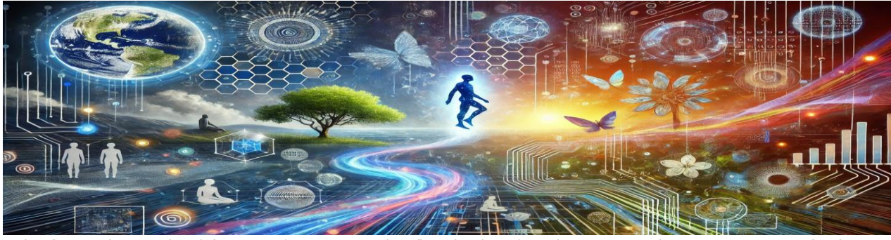
La fusion du monde réel et numérique, avec des flux de données, des circuits... Les connexions profondes et les risques de la numérisation, incitant à réfléchir sur notre interaction avec le numérique.