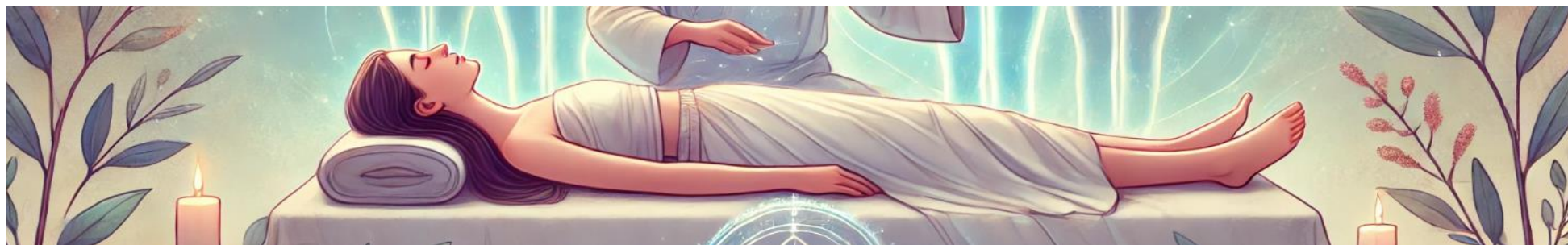
Séance d'apométrie : un guérisseur effectue des passes fluidiques au-dessus d'une patiente allongée, entourée de lumières douces.